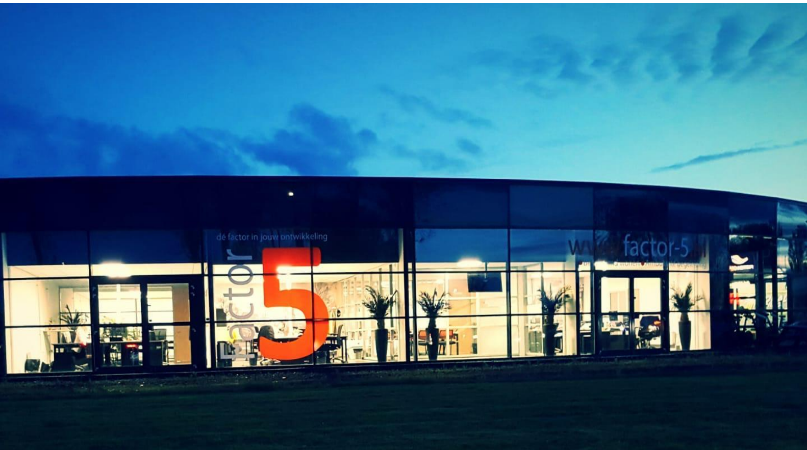
Figuur 1 Bureau Stettinweg 22, Groningen